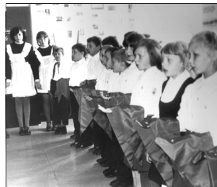
Прием в ряды Всесоюзной пионерской организации, г. Дзержинск. 1981 г.

Свой посильный вклад пионеры вносили в ходе проведения всесоюзных субботников. Например, 13 тысяч школьников из Арзамаса в октябре 1977 года посадили около пяти тысяч кустарников, собрали 119 тонн металлолома. Ребята при-