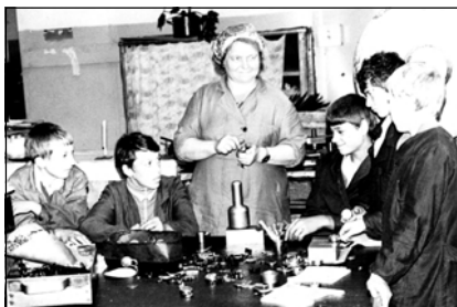
В школьной мастерской. 1970-е годы

Все занятия в школе носят коррекционный характер. Например, в начальной школе существ-