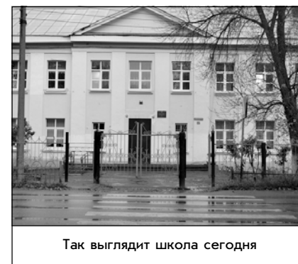
Так выглядит школа сегодня