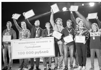
«IT-специалист России — кто он?».

9 ноября проект стартовал. В нем принимают участие команды школьников 9—11-х классов, учащихся профессиональных образовательных организаций из Нижегородской, Кировской, Самарской, Саратовской областей, Татарстана, Удмуртии. Всего 67 команд, 279 обучающихся. В Нижегородской области работают 40 команд, 160 обучающихся. Проект развернут на сайте Летописи.ру по адресу http://goo.gl/OqxlV . Этапы проекта: «Российская информатика в лицах», «25 лет отечественному интернету», «Российские интернет-сервисы», «Программирование — вторая грамотность»,