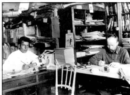
В архиве Нижегородского губкома ВКП(б). 1930-е годы

И в 20-х годах XX века, и в начале XXI столетия круг задач, решаемых архивистами, оставался неизменным: это обеспечение сохранности и государственного учета документов, их комплектование и научное использование, выявление особо ценных документов, исполнение запросов граждан о заработной плате, трудовом стаже, награждении, а также тематических запросов по истории районов Нижегородской области, предприятий и учреждений, запросов биографического характера.