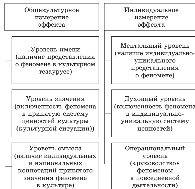
Рис. 2. Уровни измерения культурных эффектов

ности, нередко остается функционально нейтральным, не выступает императивом действия человека по освоению нового или преобразованию известного ему культурного пространства. Иными словами, если рассматривать только индивидуальное измерение культурного эффекта (поле смысла, по Г. Фреге), то и оно может быть представлено дифференцированно: на уровне ментальном (сформированность уникально-индивидуального представления о том или ином культурном феномене), духовном (включение феномена в уникально-индивидуальную ценностно-смысловую сферу, буквально — присвоение феномена), операциональном (осознанное в качестве мотива деятельности «применение» феномена) (см. рис. 2).