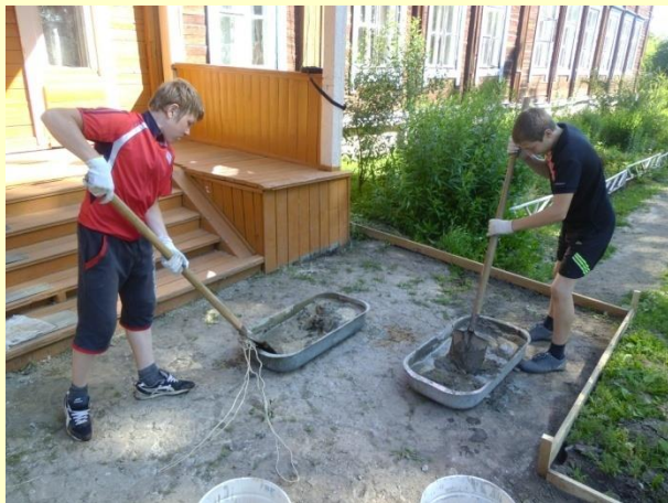
Мальчики начали работу по заливке бетонной дорожки у парадного входа в здание школы.