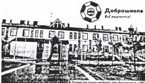
Ларьякская школа-интернат для обучающихся с ОВЗ

Новые направления работы требуют новых знаний от педагогов. Поэтому в рамках нацпроекта будет организована работа по переквалификации сотрудников.