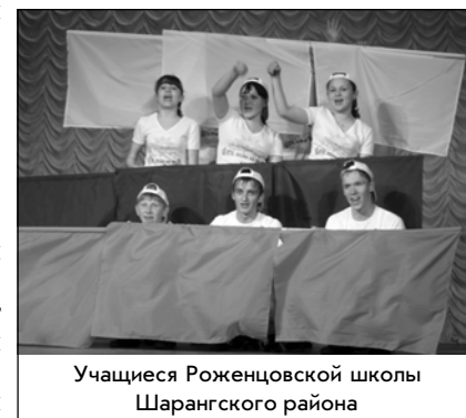
Учащиеся Роженцевской школы Шарангского района

Русский флаг входит в ряд тех флагов, которые провозглашают главенство веры